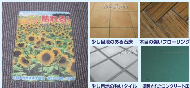
少し目地のある石床 木目の強いフローリング